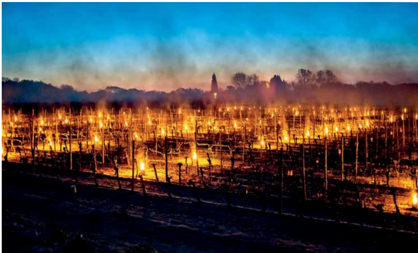
Klimatické změny sice umožnily výsadbu nových vinic, ale vinaři v Sussexu jsou připraveni i na „rozmary“ místních podmínek.