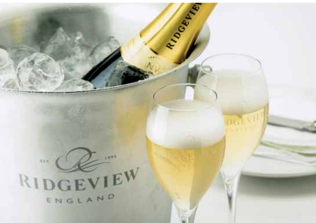
Se sklenkou vína Ridgeview v ruce lze budoucnost anglického vinařství vidět v těch nejlepších barvách.

přestože ke stejnému cíli. Tady v jižní části Anglie máme přece jenom delší vegetační období, což nám umožňuje nabídnout poněkud ovocitější typy s bohatou přirozenou kyselinkou.