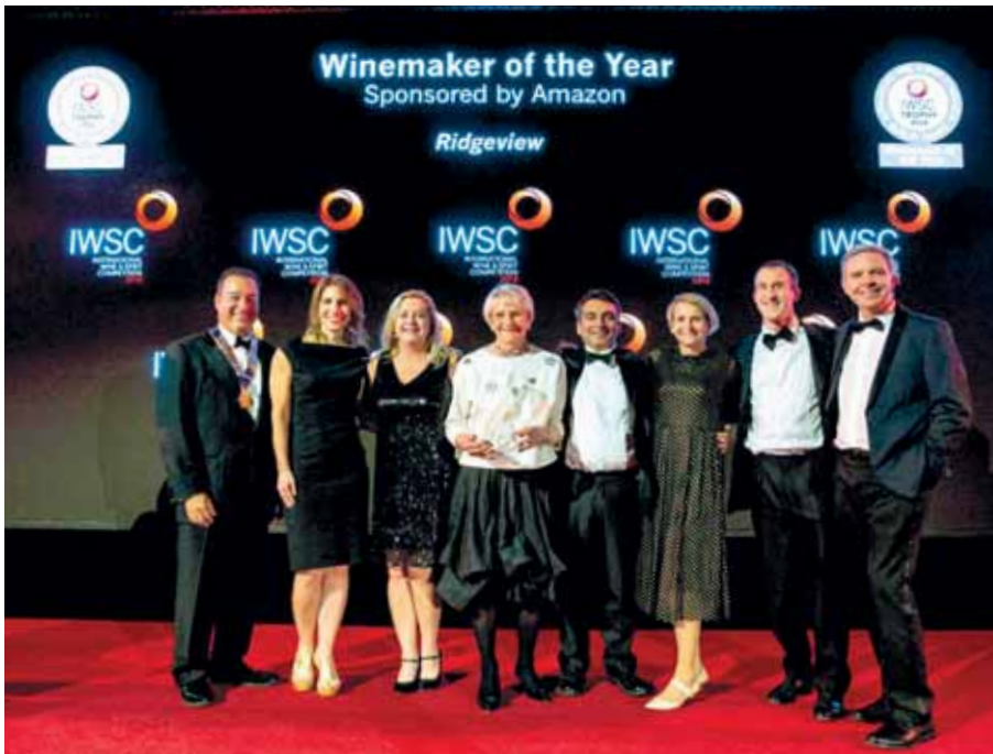
Pro celou rodinu se trofej IWSC stala nesmírně důležitým momentem historie vinařství.