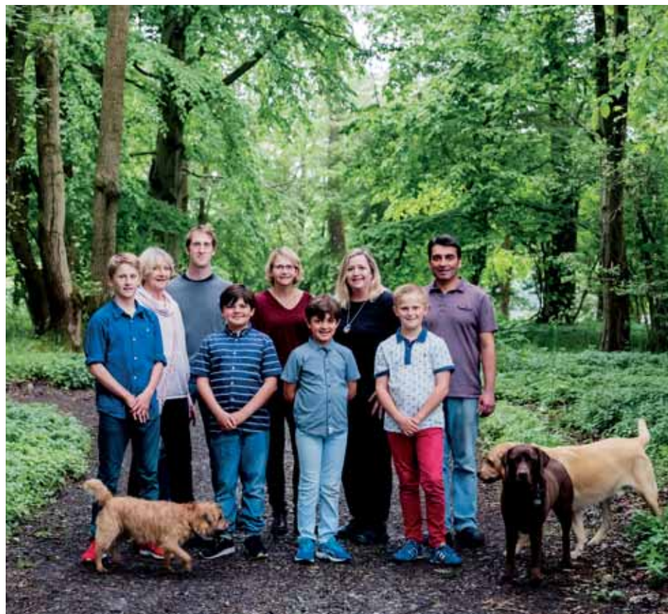
Ridgeview je rodinné vinařství v tom nejlepší smyslu.