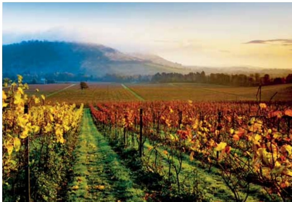
Největší vinice v Anglii (265 ha Denebies Estate) na křídové půdě na chráněných jižních svazích v srdci Surrey

ve „staré dobré Evropě“. V bývalé římské provincii Britannia, která byla pod vládou Říma až do roku 407, bylo víno každodenní záležitostí, což přesvědčivě dokládají nálezy amfor a pohárů na víno z archeologických průzkumů římských vil, větších domů a vojenských táborů na území dnešní Velké Británie. Zajímavé je, že římský historik Tacitus, jehož dílo je považováno za vrchol antického historiografického písemnictví, prohlásil, že klima této římské provincie není vhodné pro pěstování révy vinné a každý pokus tu bude neúspěšný. Slovný historik a oblíbený římský konzul tehdy nemohl tušit, že „pokusy“ po téměř dvou tisících let budou naopak velmi úspěšné. Přes Tacitovy názory se vinice přece jen vysazovaly, ale k většímu rozšíření došlo až ke konci 4. století n. l. kdy se začalo v zemi šířit křesťanství. Také proto britská historie klade počátky místního vinařství až do doby normandského vévody Viléma I. Dobyvatele (1027–1087). Ten přivedl do země mnichy s dostatečnými znalostmi výroby vína, které uměli ocenit nejen řádoví bratři, ale i jeho vojáci a celý